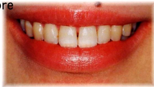
PMTC前 (歯面にたばこのヤニやコーヒー・紅茶の着色があります)