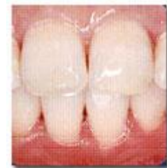
滑らかになった歯